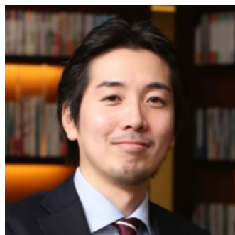
津川友介 (カリフォルニア大学 ロサンゼルス校)